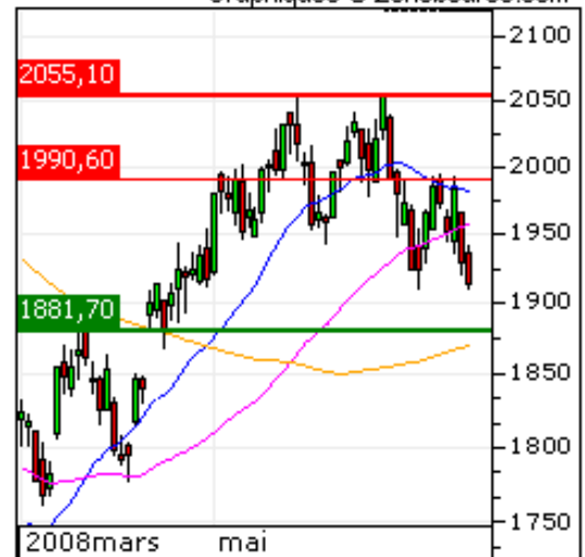
NASDAQ-100 Tendances : Court Terme Moyen Terme Graphiques