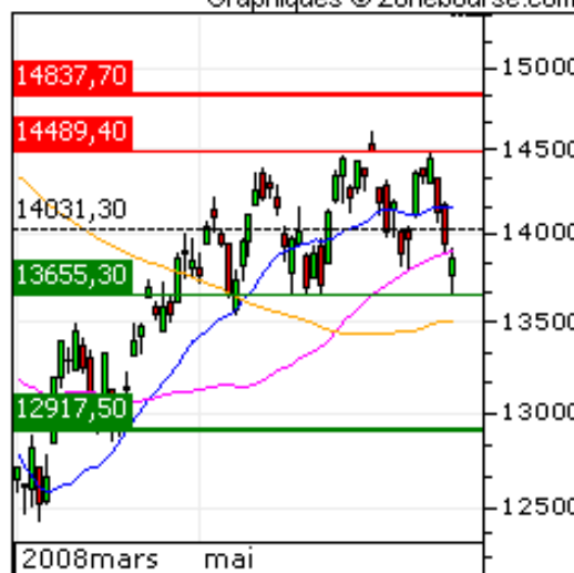
NIKKEI 225 Tendances : Court Terme Moyen Terme Graphiques