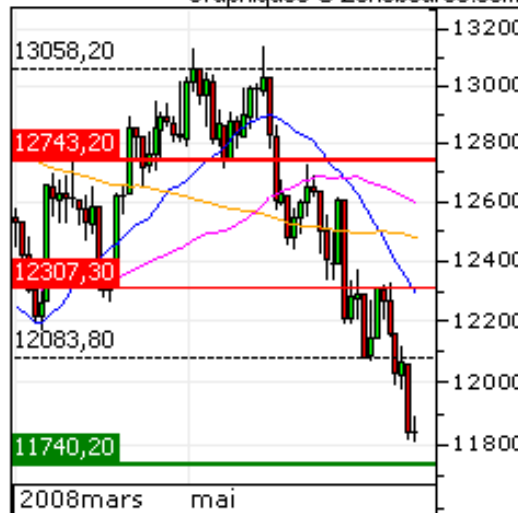
DOW JONES Tendances : Court Terme Moyen Terme Graphiques © Zonebourse.com